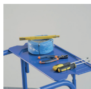
Tablette porte-outils très large en tôle d'acier époxy