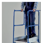
Le portillon s'ouvre vers l'intérieur pour garantir la sécurité anti-chute