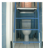
Béquille arrière permettant d'enjamber des obstacles (ex: WC)