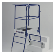
Travail en décalage de niveau