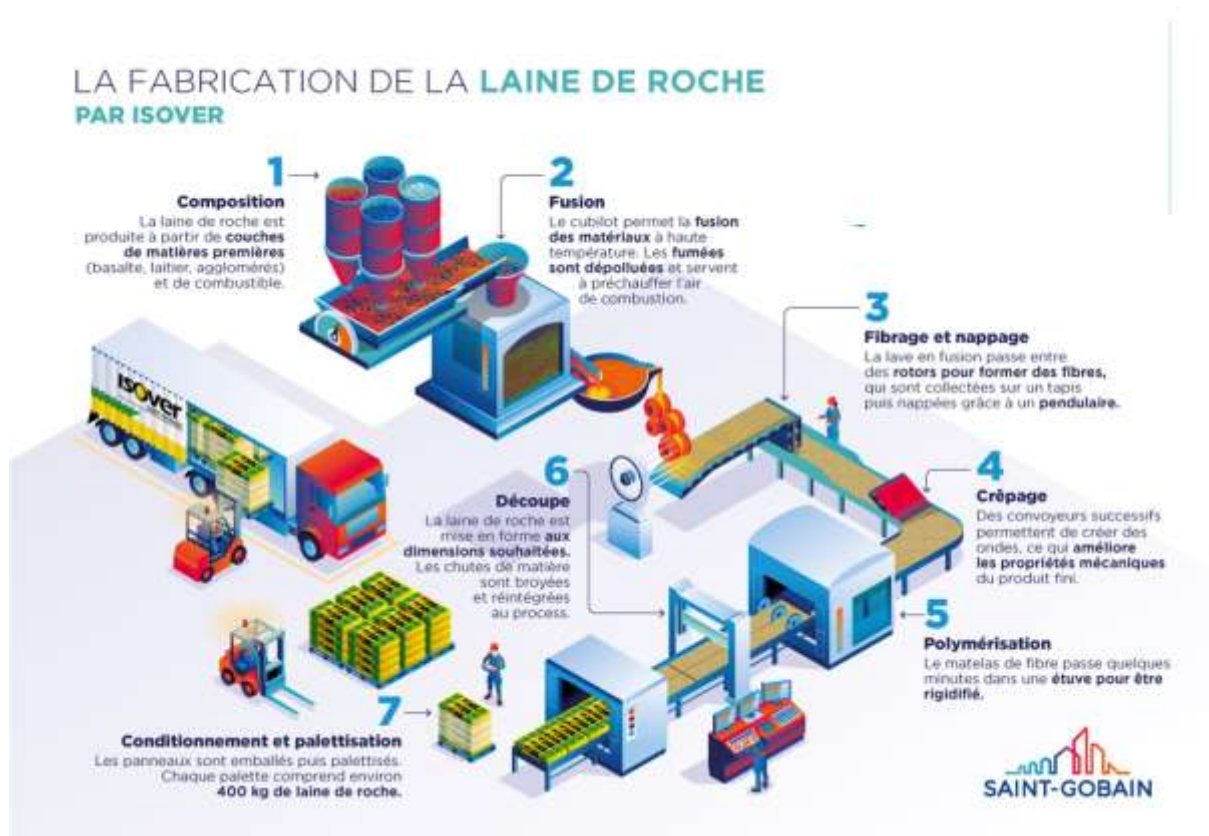
Diagramme du procédé de fabrication

La fabrication de laine de roche inclut les étapes de fusion et de fibrage (cf. diagramme du procédé de fabrication). De plus, la production des emballages est prise en compte à cette étape, incluant le prélèvement de CO 2 atmosphérique sous forme de carbone biogénique dans le bois de la palette.