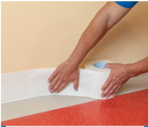
1. Application du Mapecontact Plus au mur