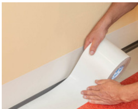
4. Mise en place d'une nouvelle bande de Mapecontact Plus au sol, puis maroufler