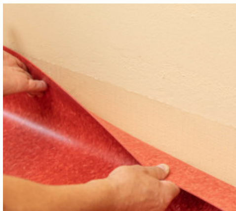
7. Pose du revêtement en mur