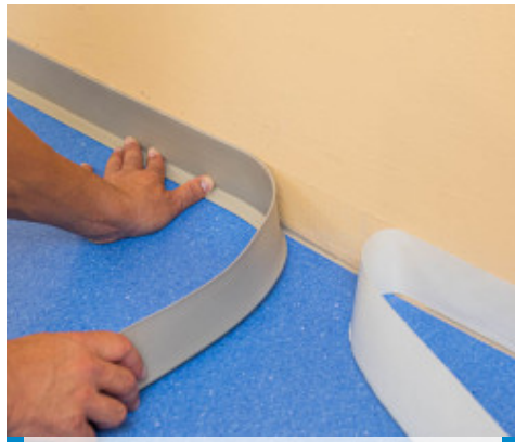
2. Retirer le papier protecteur, puis afficher le profilé