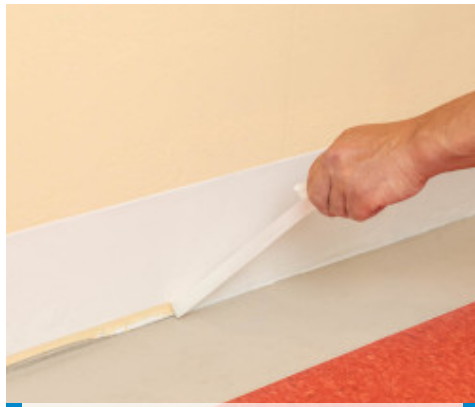
2. Retirer une partie du papier protecteur