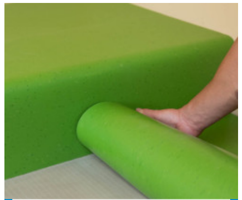
3. Pose du revêtement sur les marches