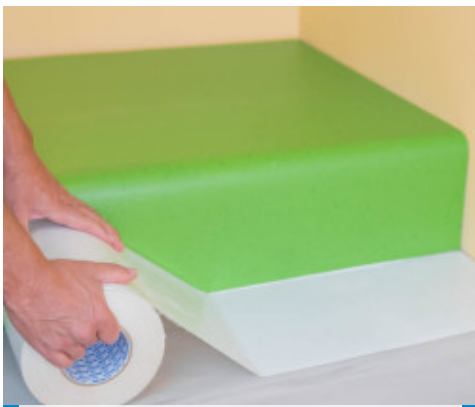
1. Afficher Mapecontact Plus sur le plat de marche et la contremarche