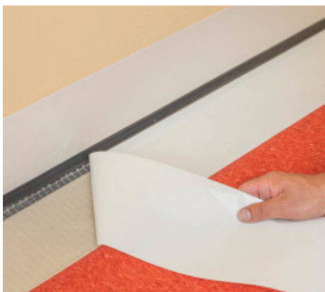
5. Retirer le papier protecteur