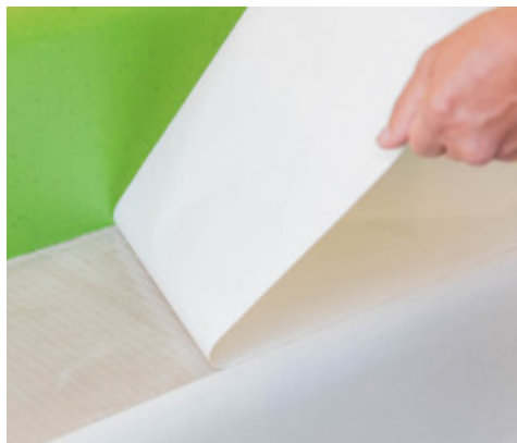
2. Retirer le papier protecteur