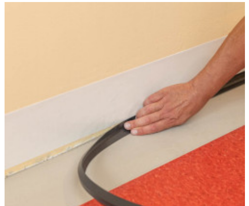
3. Pose d'un angle pré-formé