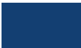
P4550 modrá návestná