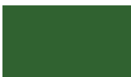
P5300 zelená stredná