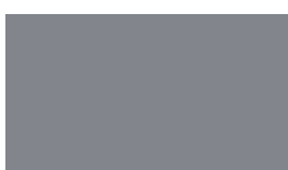
P1110 sivá svetlá