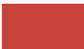
P8140 červená rumelková svetlá