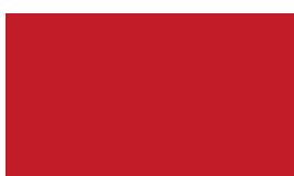
P8190 červená rumelková tmavá