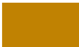
P6700 oker svetlý